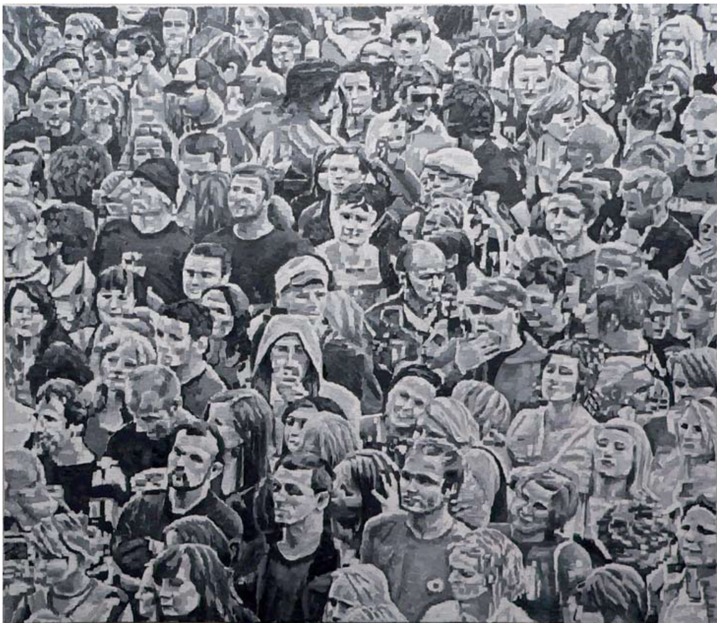
Tom Fleischhauer, Open Air I , 2009, Huile sur toile, H. : 130 cm, L. : 150 cm.