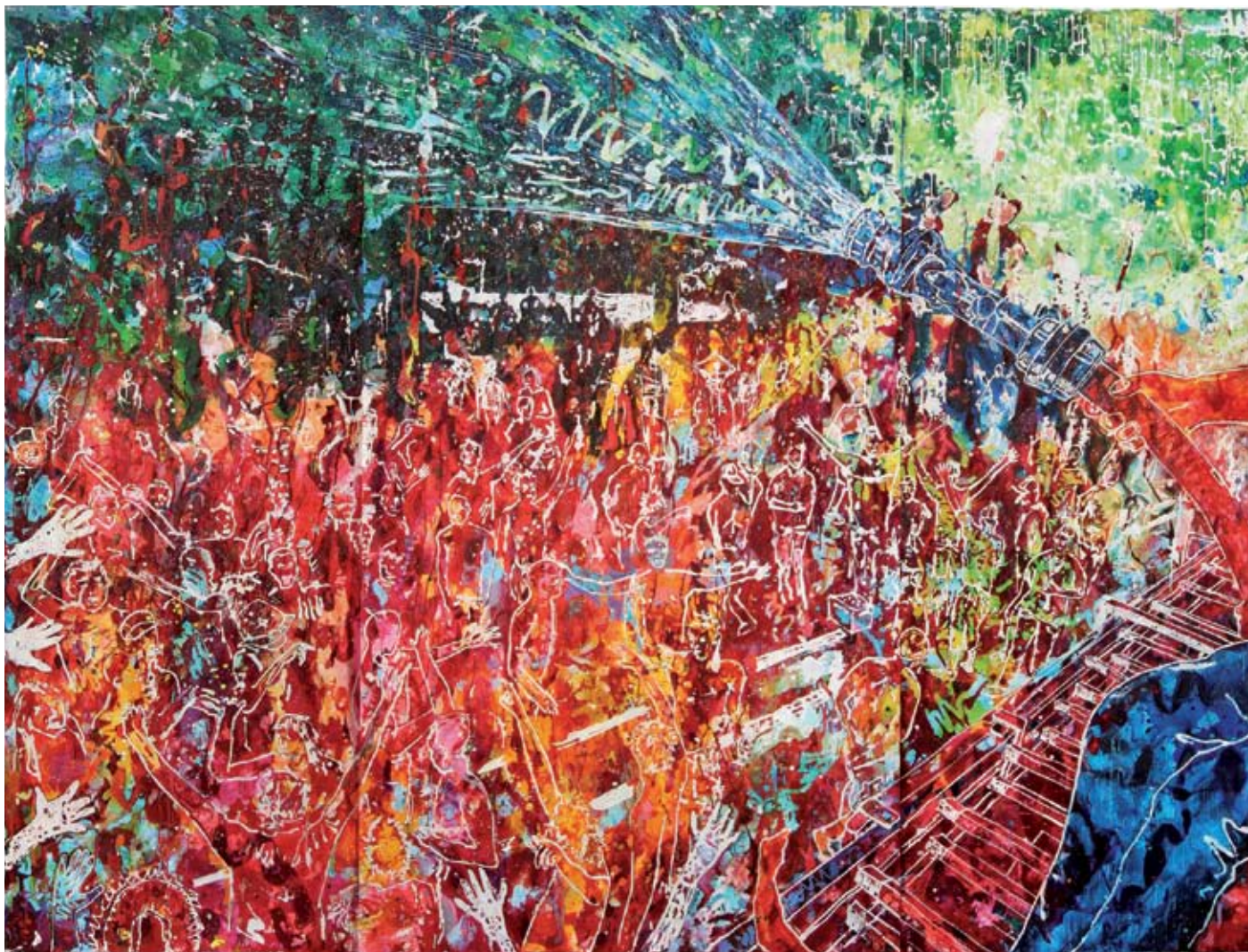
Christian Awe, Brennen für Deutschland , 2007, Acrylique, aquarelle sur papier, H. : 265 cm, L. : 352 cm.