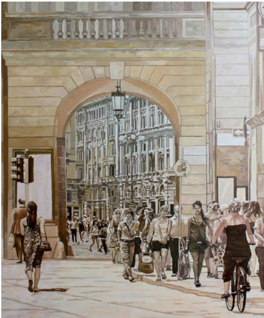
Tom Fleischhauer, Via Verdi , 2009, Huile sur toile, H. : 180 cm, L. : 150 cm.