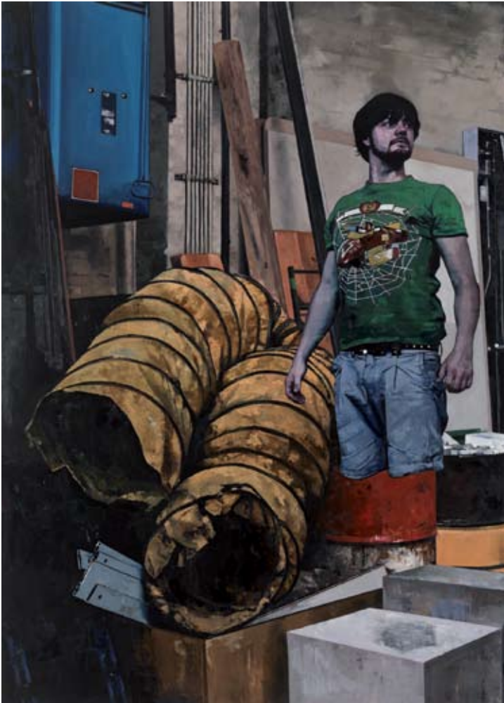
Sebastian Schrader, Fragment , 2009, Huile sur toile, H. : 250 cm, L. : 180 cm.