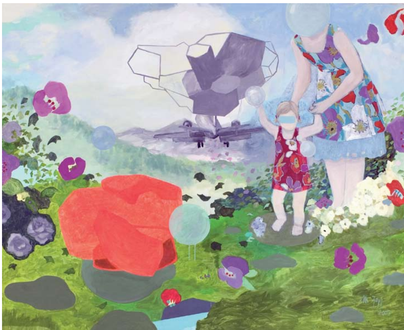
Meike Zopf, Idylle VI , 2009, Acrylique et fusain sur toile, H. : 160 cm, L. : 190 cm.