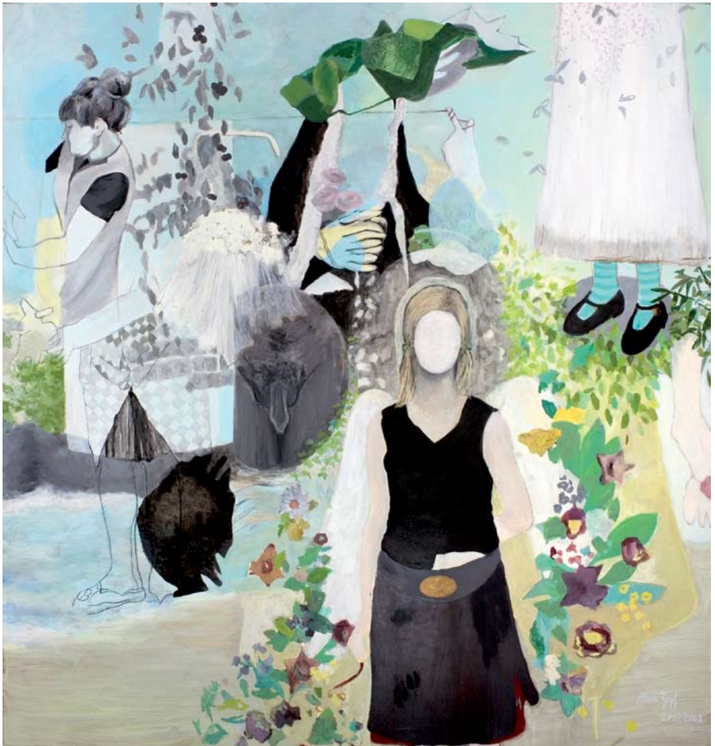
Meike Zopf, Leuchtende Stunden II , 2009, Acrylique et fuscain sur toile, H. : 210 cm, L. : 200 cm.