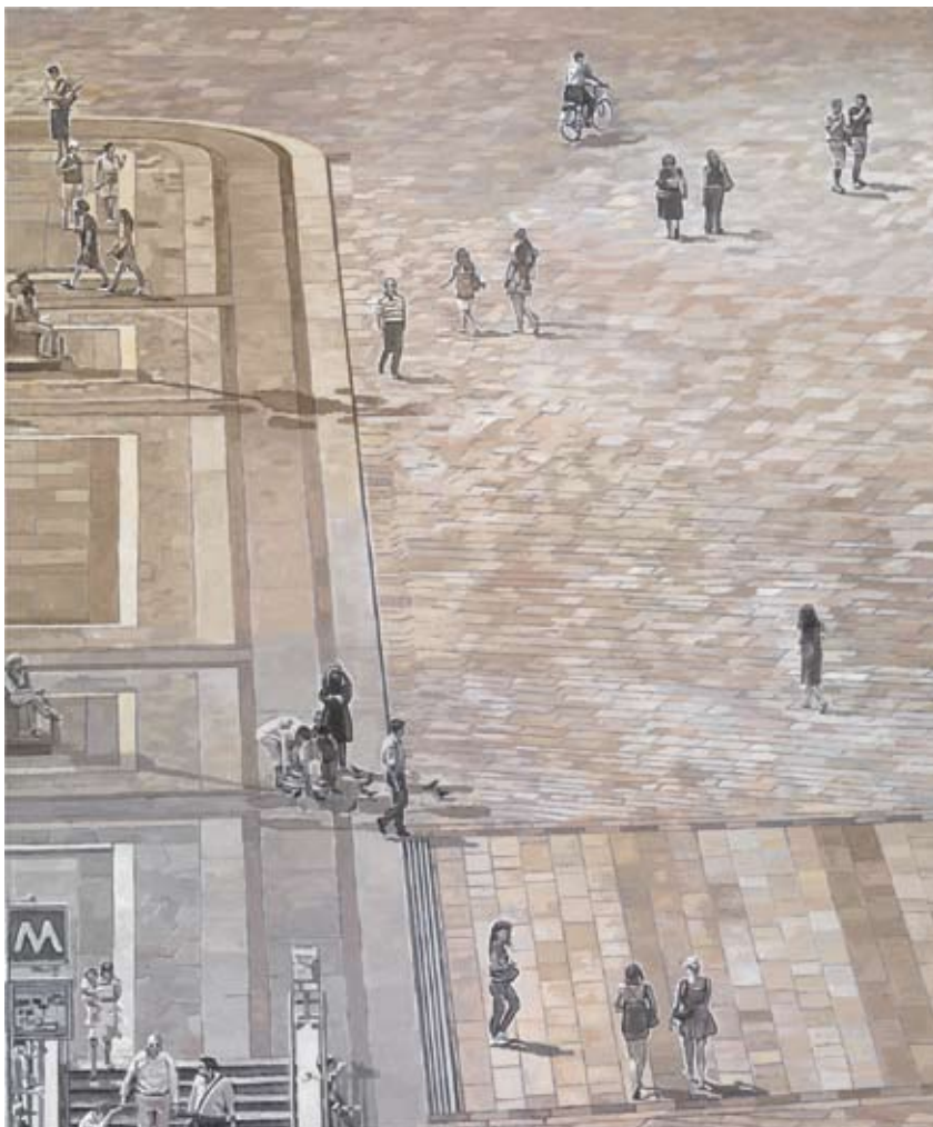
Tom Fleischhauer, Piazza II , 2009, Huile sur toile, H. : 180 cm, L. : 150 cm.