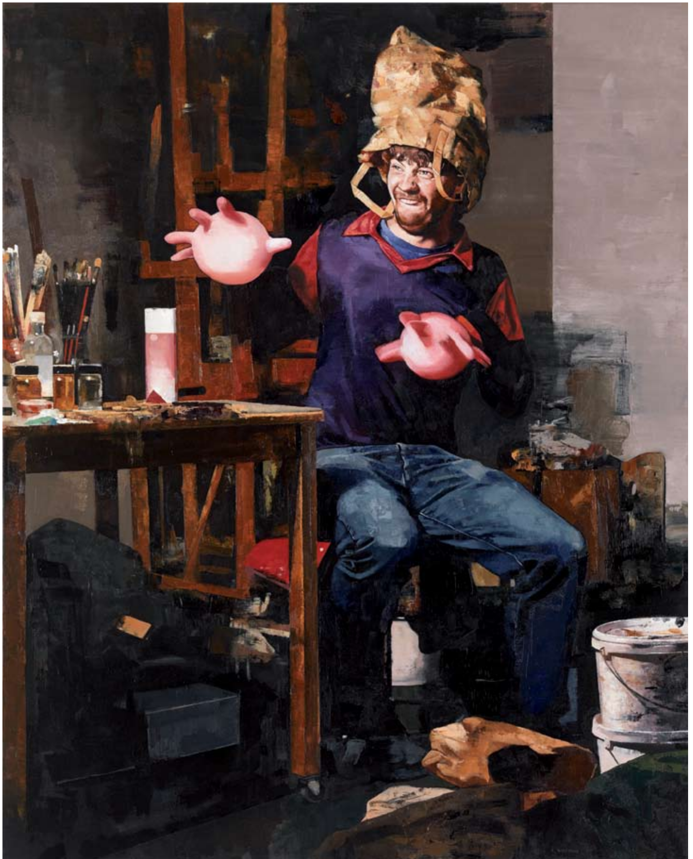
Sebastian Schrader, Chopin , 2009, Huile sur toile, H. : 150 cm, L. : 120 cm.