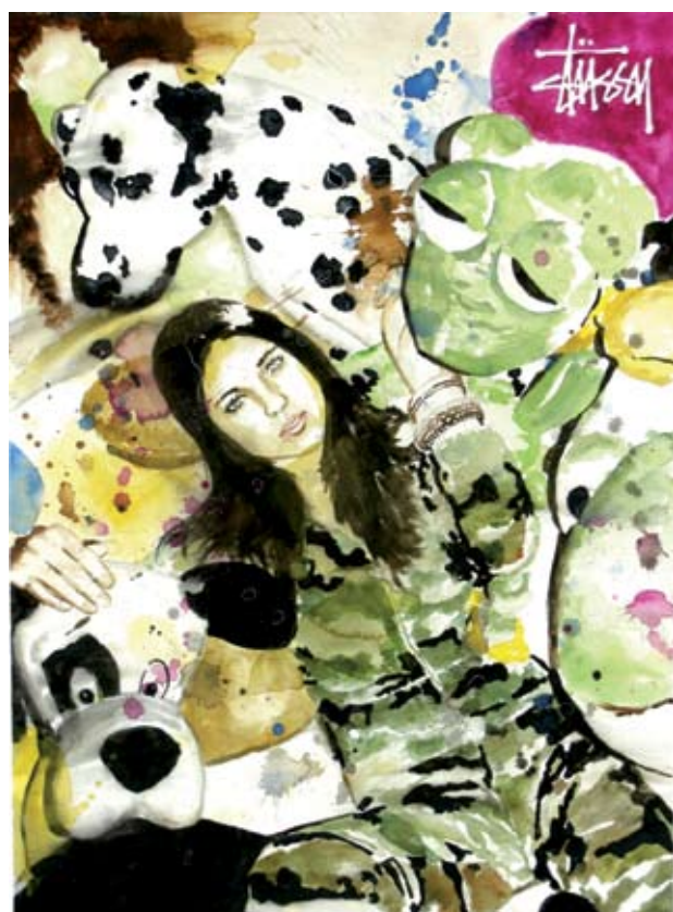
Jörg Lohse, Hello , 2008, Huile sur toile, H. : 190 cm, L. : 150 cm.