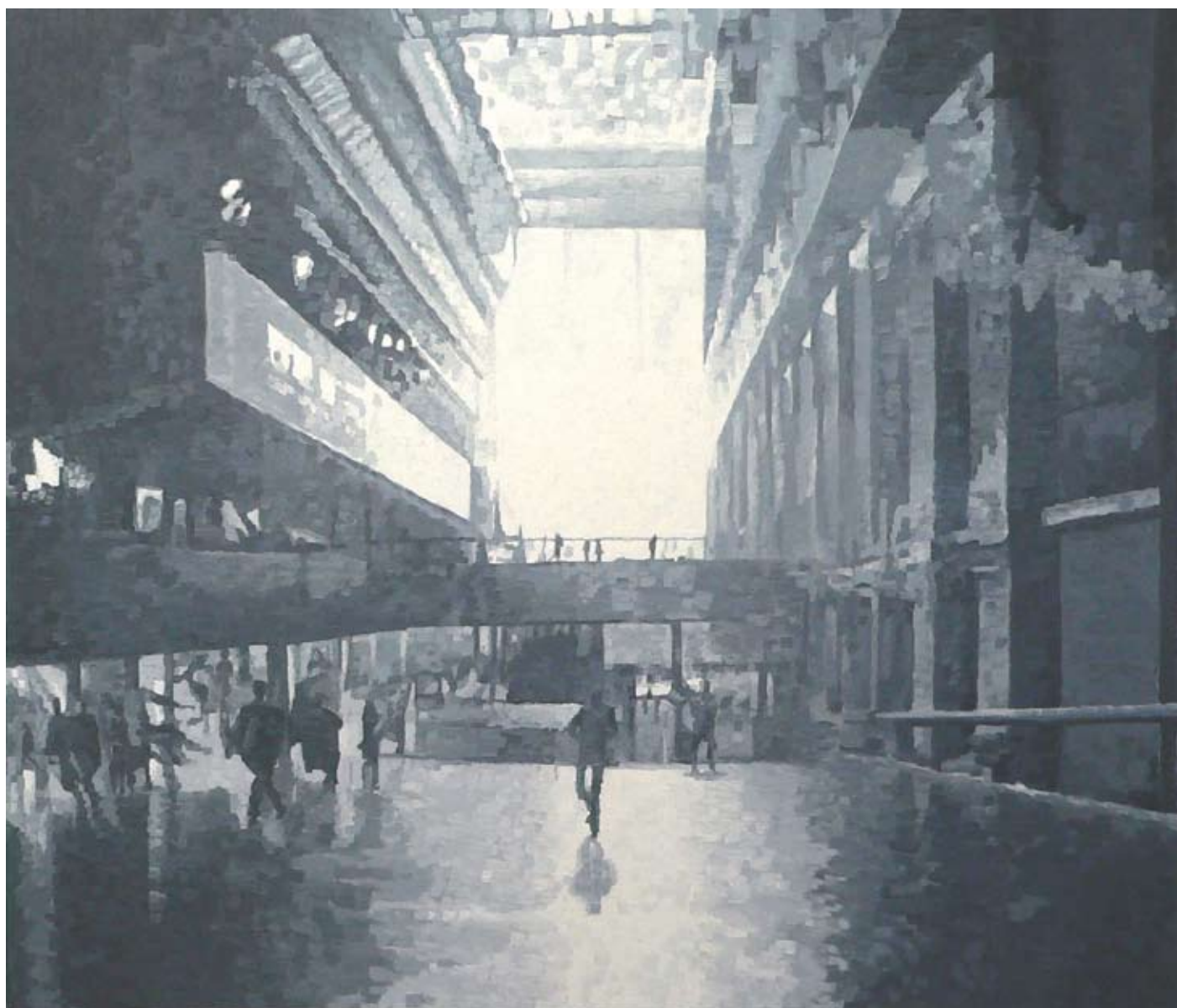
Tom Fleischauer, Terminal , 2008, Huile sur coton, H. : 155 cm, L. : 180 cm.