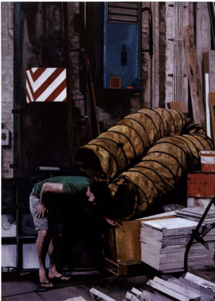
Sebastian Schrader, Versteck , 2009, Huile sur toile, H. : 250 cm, L. : 180 cm.